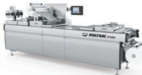
z. B. Tiefziehverpackungsmaschine R 085