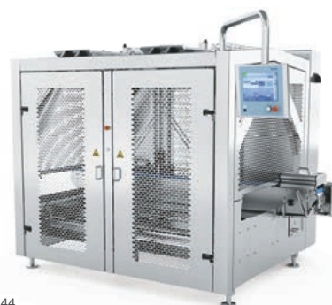
z. B. Handhabungsmodul H 244