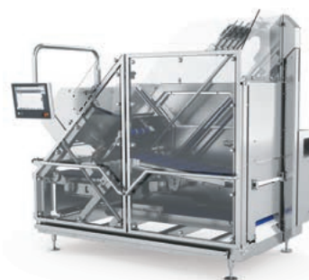
z. B. Slicer S 800 / S 1600

Darauf können Sie vertrauen: Zuverlässigkeit, Langlebigkeit und ein umfassender Service machen MULTIVAC zu einem belastbaren Glied in Ihrer Produktionskette.