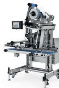
z. B. Transportbandetikettierer L 310 Full Wrap Labeller